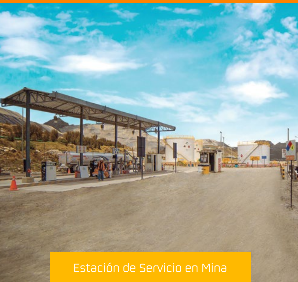
Estación de Servicio en Mina