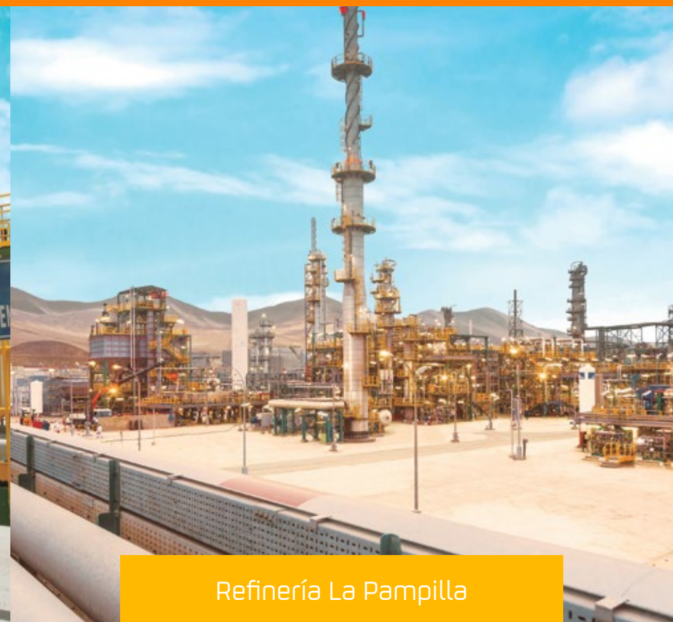
Refinería La Pampilla