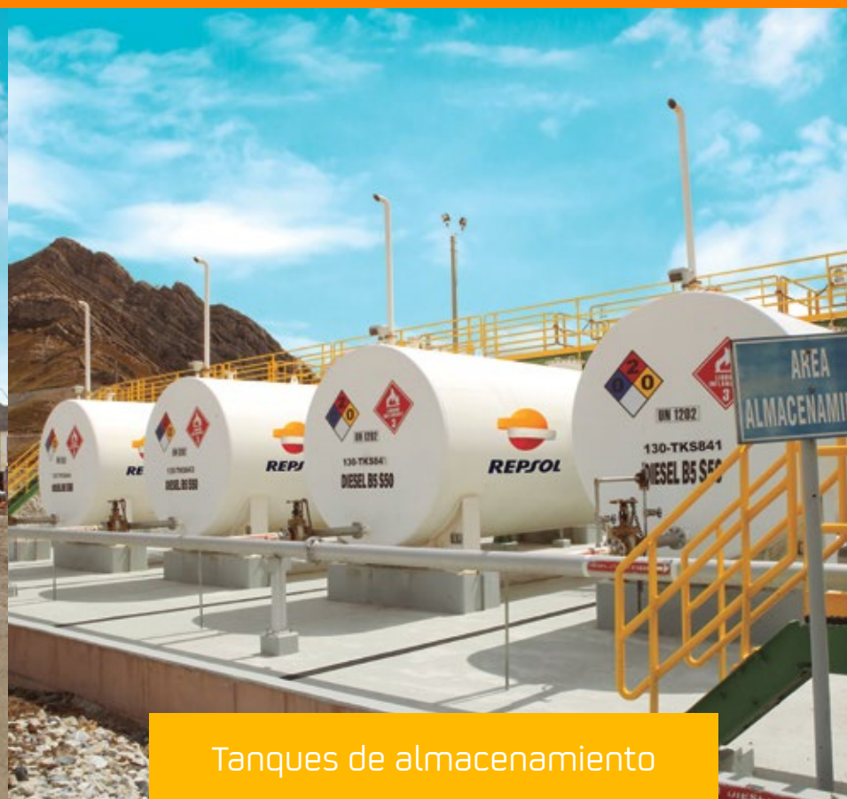
Tanques de almacenamiento